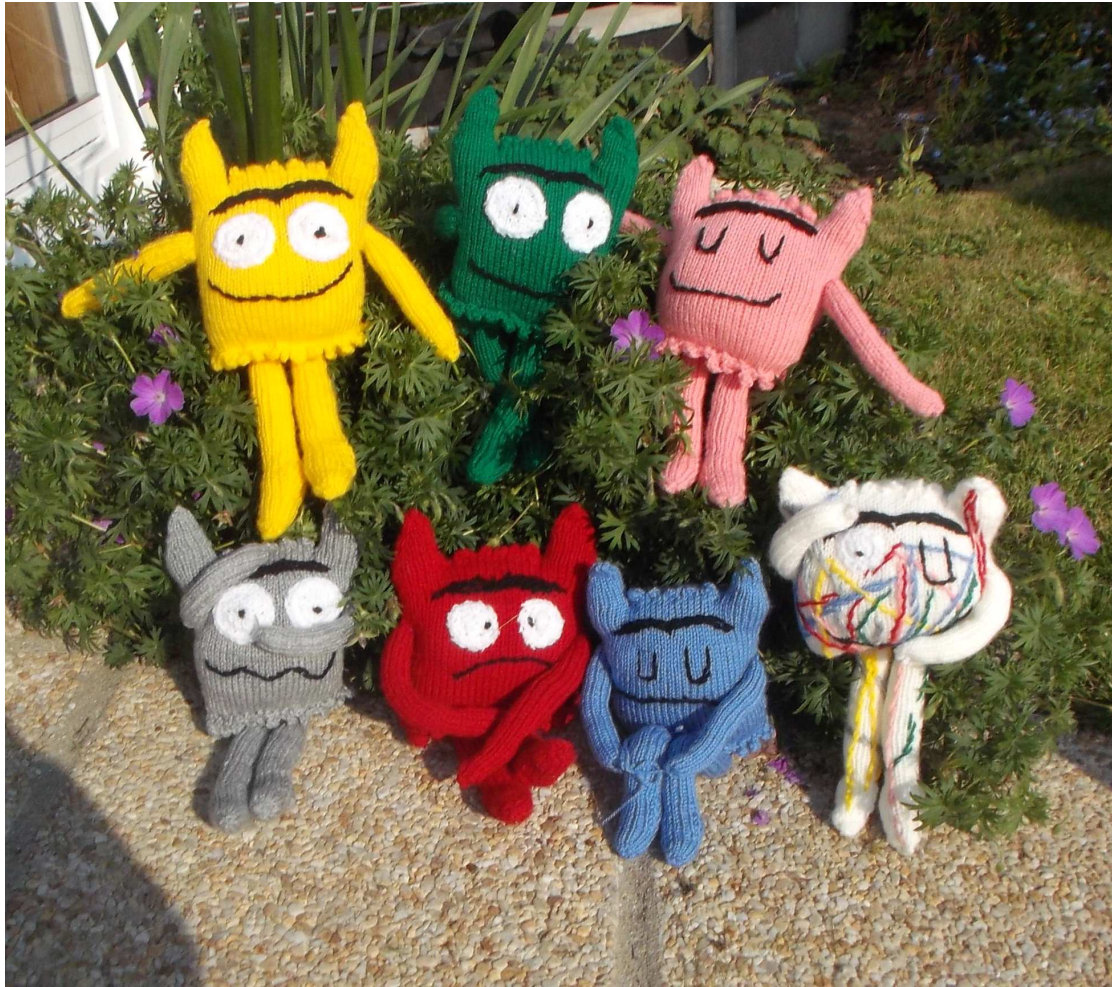
les monstres couleur des émotions